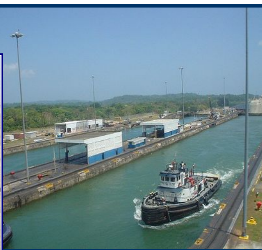
Canal de Panama

Lundi 08 NOVEMBRE 2010 à 19h Restaurant l'Océanide Hôtel MERCURE, Bassin des Chalutiers A La Rochelle