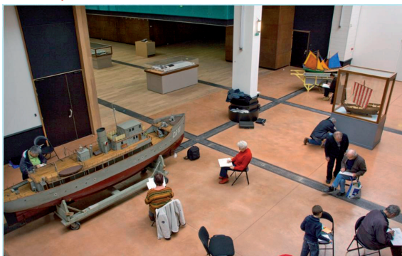
Nos Amis peintres ont investi le musée et exercent leur talent in situ